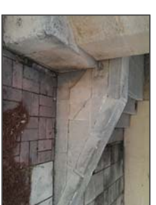
Piezas en deterioradas en perfiles laterales