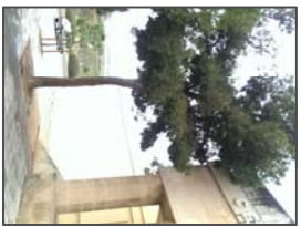
Arco sobre pórtico en lateral izquierdo