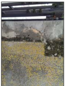
Andadje puerta de acceso a cementerio