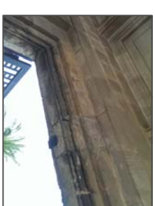
Resarco puerta de acceso