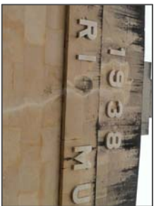
Fisura central en pórtico