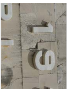
Inscripción elaborada mediante piezas de mármol