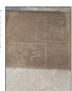
Fachada interior pórtico