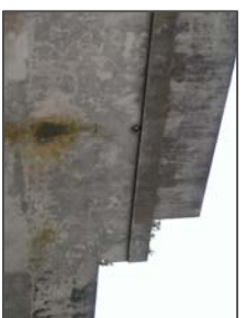
Garajes en fachada posterior